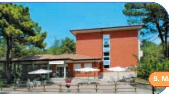
S. Maria del Mare