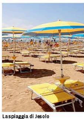
La spiaggia di Jesolo

Operatori imbufaliti per le previsioni su Internet spesso imprecise. E in Veneto si punta a un servizio fai da te