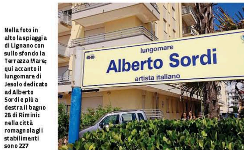
Nella foto in alto la spiaggia di Lignano con sullo sfondo la Terrazza Mare; qui accanto il lungomare di Jesolo dedicato ad Alberto Sordi e più a destra il bagno 28 di Rimini: nella città romagnola gli stabilimenti sono 227